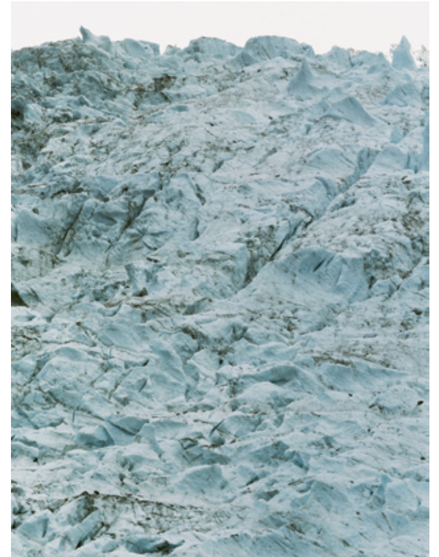
Glacier des Bossons, Frankreich, 1997