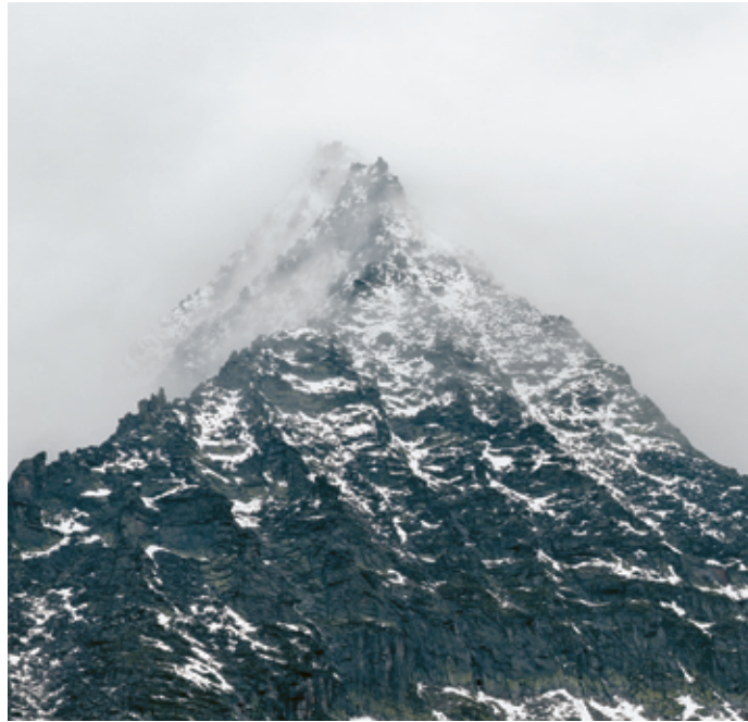
Totenkopf, Österreich, 2011