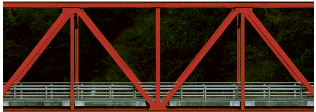
Ise (Bridge), Japan, 2012/17 Kunstpalast, Düsseldorf – Dauerleihgabe aus der Sammlung der Stadtparkasse Düsseldorf