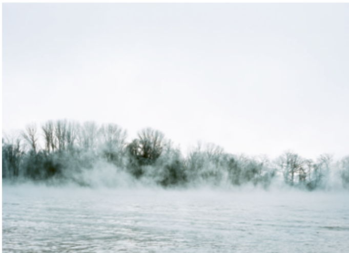
Rheingau/Nebel-1, Deutschland, 2009